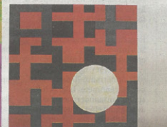
Olle Borg, "XX III / III", olja och aluminiumfärg på aluminium.